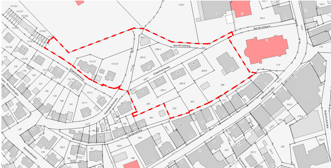
Lage Plangebiet (ohne Maßstab)

Das Plangebiet befindet sich im Stadtzentrum von Furtwangen, unterhalb des Friedhofs, im Übergangsbereich zwischen Innenstadt und angrenzendem Wohngebiet. Das Plangebiet hat eine Größe des Geltungsbereichs von ca. 1,24 ha (Flächenermittlung CAD). Die genaue Abgrenzung ergibt sich aus den Darstellungen in der Planzeichnung.