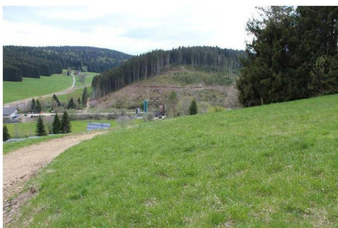
Fotos des Planungsbereichs